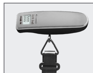
Sistema de sujeción de correa